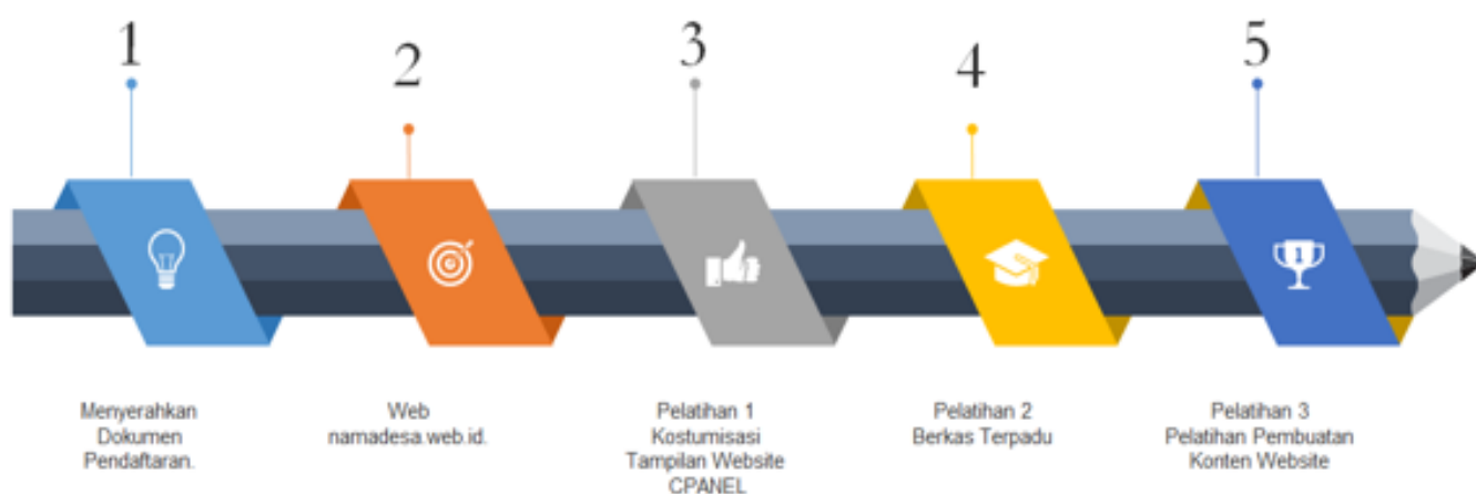
Gambar 1. Alur Pelaksanaan Pengabdian

Metode pengabdian masyarakat ini akan dilakukan dengan cara: