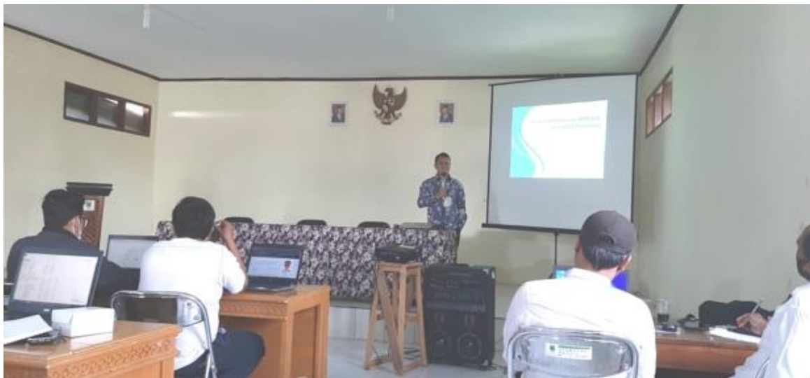
Gambar 4. Kegiatan Pelatihan Website

Pelatihan diikuti Sekretaris Desa, pamong desa dan operator web yang ditugaskan secara khusus untuk menangani website desa. Pelatihan dilakukan selama satu hari penuh yaitu mulai jam 08.00 sampai dengan jam 16.00, bertempat di Aula Kecamatan Jalaksana Kabupaten Kuningan. Kegiatan pelatihan dapat dilihat seperti pada gambar 4.