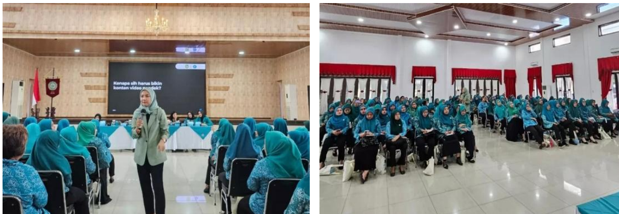
Gambar 1. Dokumentasi Pelatihan Tata Kelola Keuangan PKK Medan Petisah

Kegiatan ini memiliki potensi untuk dikembangkan sebagai model pelatihan terintegrasi bagi organisasi perempuan di wilayah urban lainnya. Pengenalan perangkat lunak sederhana seperti Microsoft Excel dan aplikasi pencatatan digital dapat mempercepat proses modernisasi pengelolaan keuangan komunitas. Peluang kerja sama terbuka luas dengan pihak kelurahan, dinas pemberdayaan perempuan, serta Universitas Battuta sebagai pendamping teknis dan akademik.